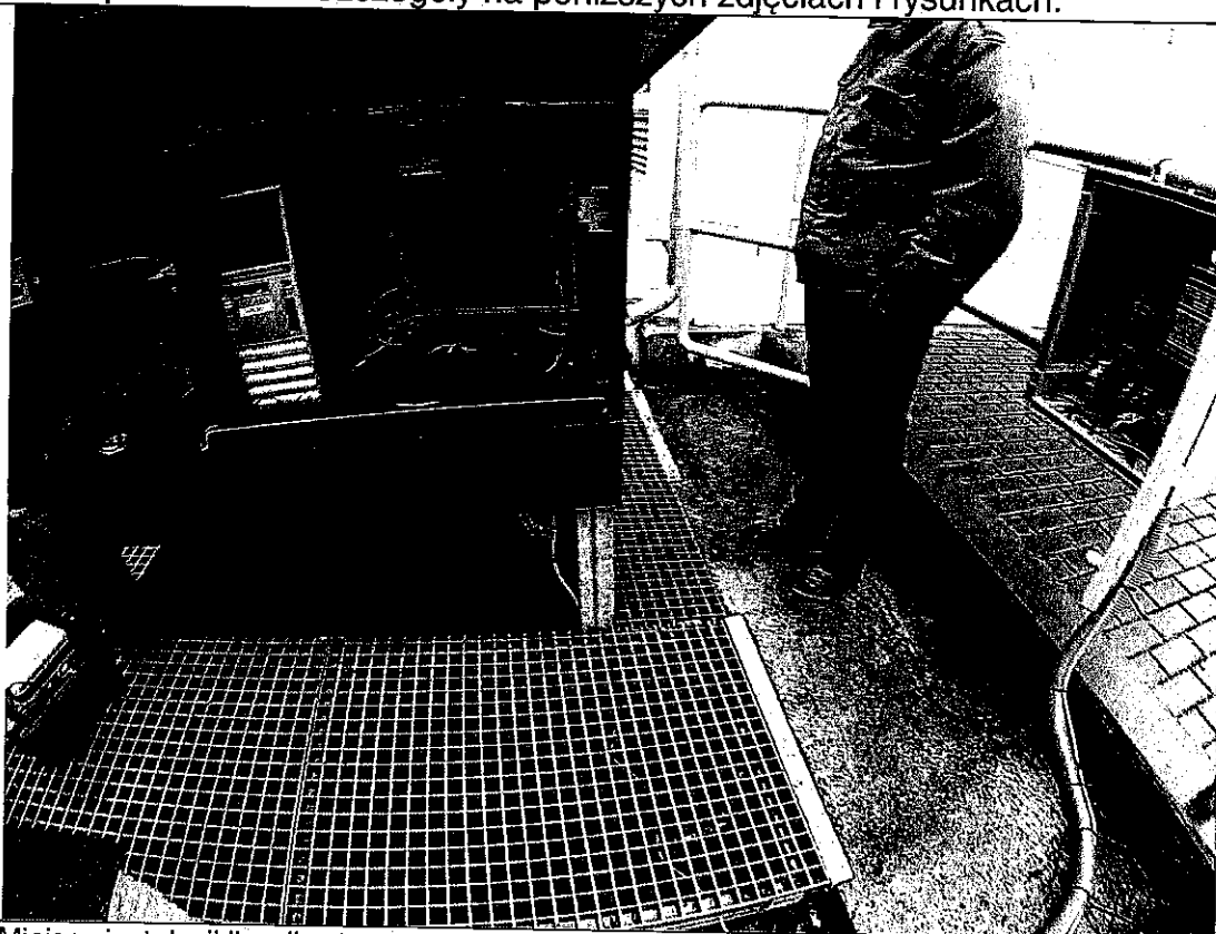
Miejsce instalacji licznika 1

Urządzenie zostanie zainstalowane po akceptacji planu montażu urządzenia w udostępnionej przepławce. W miejscu instalacji jest dostępna instalacja elektryczna 230 V z zabezpieczeniami. Szczegóły na poniższych zdjęciach i rysunkach.